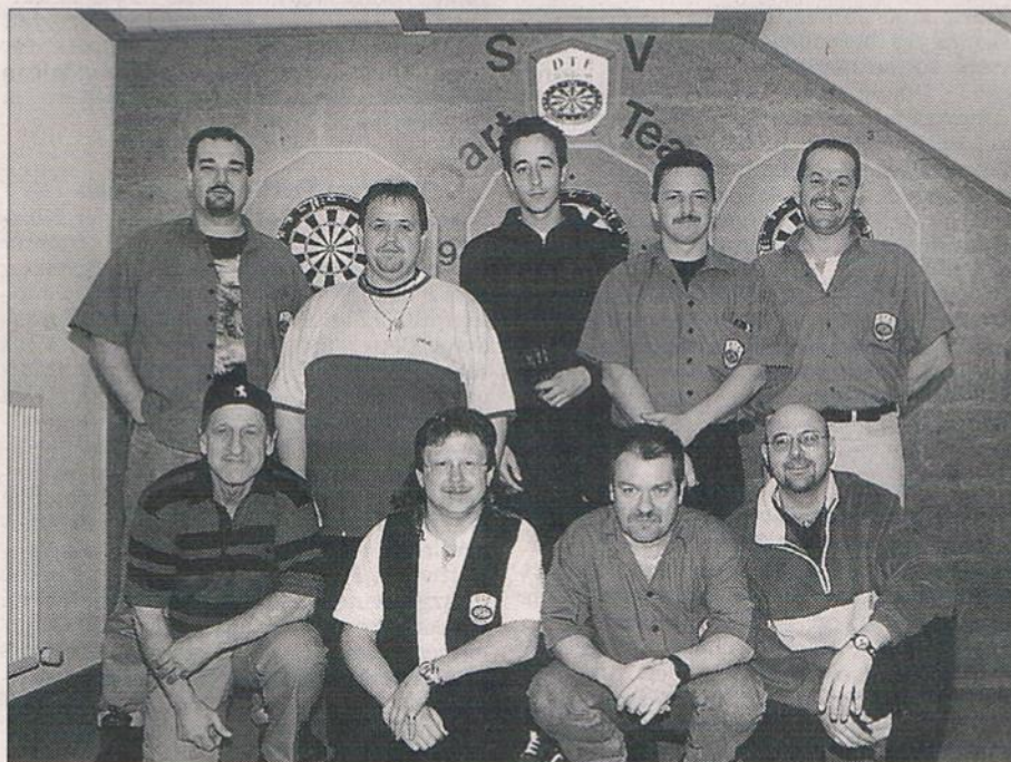
Am letzten Spieltag hat es doch noch geklappt: Das Essenbacher Dart-Team I bleibt in der Bayernliga

Dart-Team I sicherte sich Klassenerhalt in der höchsten bayerischen Liga